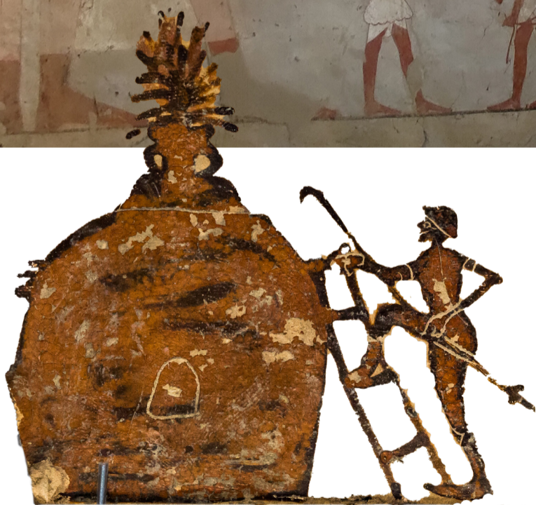
Wandmalerei aus dem thebanischen Grab TT 74 – Darstellung auf einem korinthischen Pinax – Koptischer Papyrus mit magischen Sprüchen