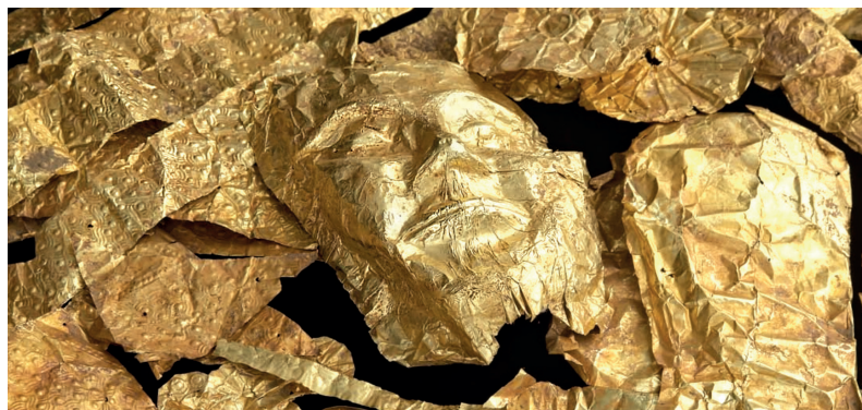
Goldobjekte aus der Raubgrabung eines Friedhofs bei Thessaloniki, 2011 konfisziert.