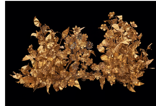
Myrtenkranz aus goldenen Blüten, aus illegalen Grabungen in Nordgriechenland, 350-300 v. Chr., 1993 ans J. Paul Getty Museum gelangt und seit 2005 im Archäologischen Museum Thessaloniki.

For more on the topic: www.stolenpast-lostfuture.org