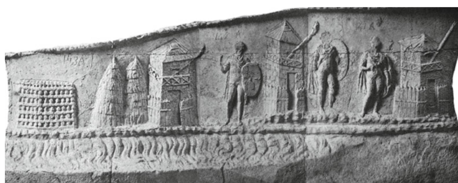
Das Relief an der Trajanssäule in Rom (113 n. Chr.) zeigt römische Wachtürme an der Donau, daneben Heu- oder Strohschober für die Versorgung der Pferde und ein Holzstoss für die Feuersignale. An jedem Turm ist eine Fackel angebracht, die wohl zur Nachrichtenübermittlung diente. So ähnlich könnten auch die Wachtürme am Rhein ausgesehen haben.

Informationstafel der Kantonsarchäologie Aargau