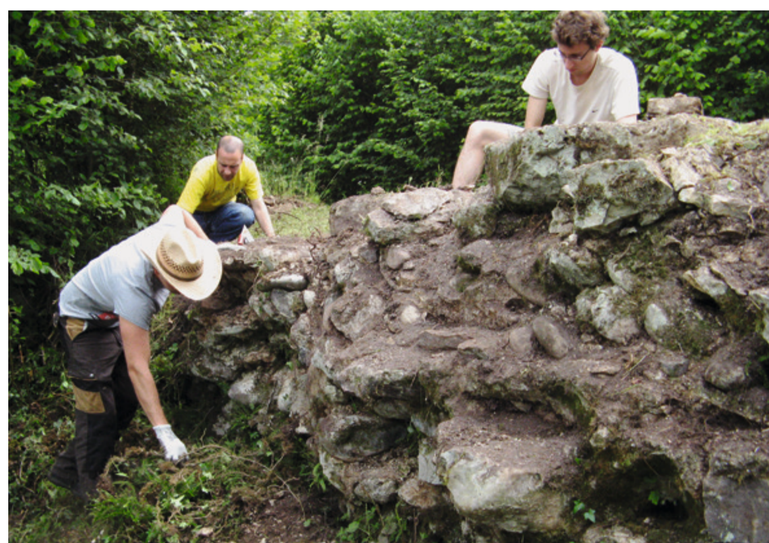
Studierende der Universität Basel legen im Juni 2014 die Überreste der Südmauer frei.