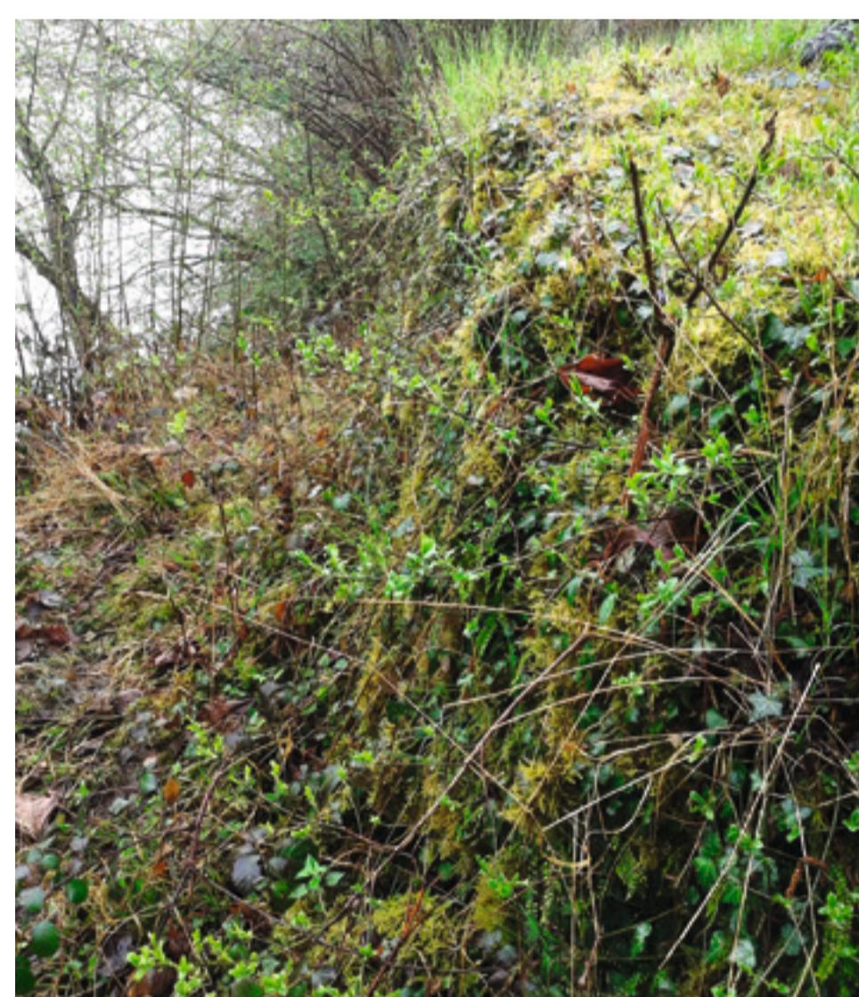
Nach den Untersuchungen 1918/19 geriet die Südmauer des Wachturms in Vergessenheit und war kaum noch sichtbar (April 2014).

Kaiser Valentinian (364–375 n. Chr.) liess zwischen Basel und Bodensee rund 50 Wachtürme und andere militärische Anlagen errichten. Sie standen in Sichtverbindung und dienten zur Überwachung und Alarmierung der Truppen in den Befestigungen (CASTRA). Neben dem Wachturm «Untere Wehren» wurden im Bereich von Möhlin noch weitere Wachtürme entdeckt. Sie sind über den Flussuferweg gut zu erreichen.