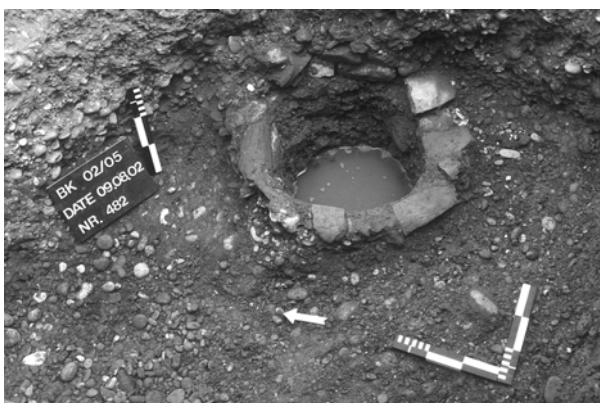
Fast 2000 Jahre alt und immer noch funktionsfähig: römische Wasserfassung. Zu der Lehrgrabung des Seminars für Ur- und Frühgeschichte in Biesheim/Kunheim siehe S. 4-7.