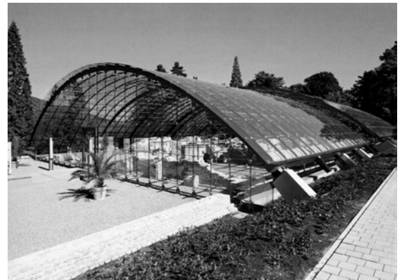
Ansicht des Schutzbaus über der Badenweiler Badruine.