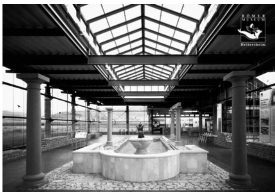
Innenansicht des Römermuseums Heitersheim (Postkartenmotiv).

Der im Juni vergangenen Jahres der Öffentlichkeit zugänglich gemachte Schutzbau im Areal der «Römervilla Heitersheim» erfreut sich regen Zuspruchs von Nah und Fern. Kurz vor Ostern, am 25. März 2002, öffnete das Museum zur 2. Saison seine Pforten. Zu