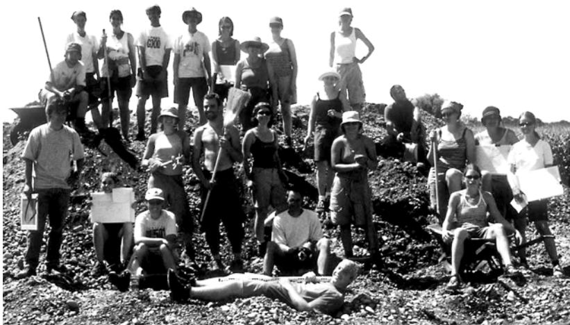
Das Grabungsteam des Seminars für Ur- und Frühgeschichte der Universität Basel.

Wichtig schien auch ein früher Kontakt mit dem genius loci : anlässlich einer Exkursion nach Biesheim wurden nicht nur die Grabungsareale der deutschen, der französischen und der Basler Equipe besichtigt, sondern auch das Musée gallo-romain.