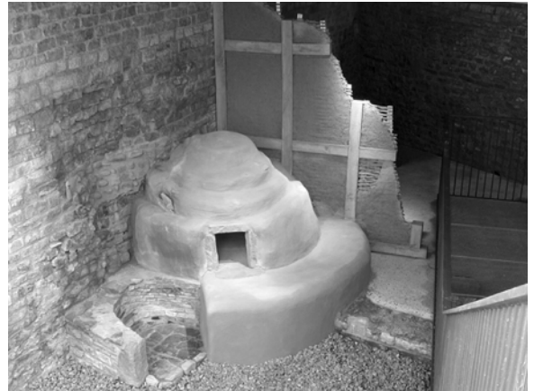
Der am besten erhaltene römische Backofen nördlich der Alpen. Auf der Herdstelle daneben konnte mit der Ofenasche – die ja zum Backen herausgewischt werden musste – gekocht werden.

Dieser neu präsentierte Gebäudekomplex ist ein gutes Beispiel für die vielfältige Arbeit, die in Augusta Raurica geleistet wird. So graben und interpretieren nicht nur die Archäologinnen und Archäologen, nein auch die Restaurierungskunst ist in hohem Masse gefordert, und die Zeichner und Museumspädagoginnen müssen die Überlegungen der Wissenschaftlerinnen und Wissenschaftler für das Publikum verständlich umsetzen.