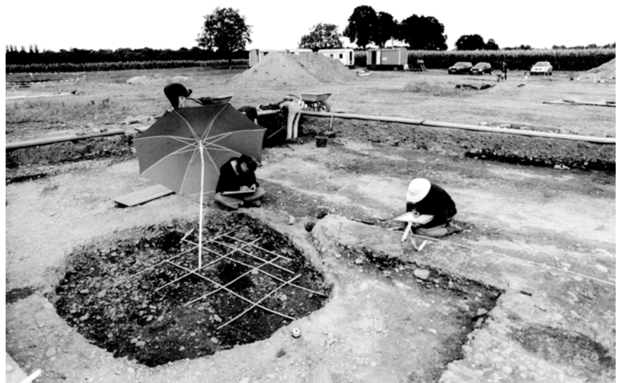
Oedenburg-Altkirch. Spät-römische und frühmittelalterliche Besiedlung im Festungsbereich (Prov.-Röm. Arch., Universität Freiburg i. Br.).