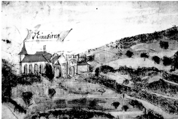
Früheste Darstellung des Antoniterklosters Nimburg von 1589. Ausschnitt aus der Landtafel von Eichstetten (Generallandesarchiv Karlsruhe).