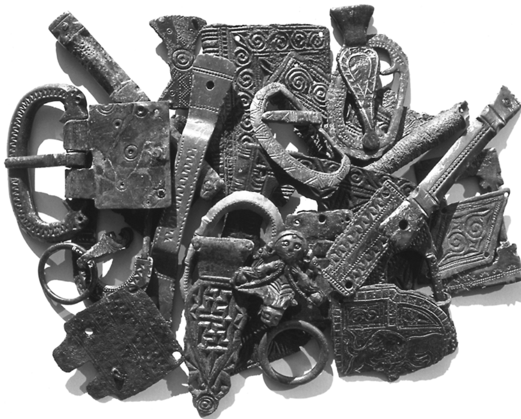
Beschläge spätromischer Militärgürtel vom Geißkopf, Gemeinde Berghaupten, Ortenaukreis.

doppeltem Sinne erfolgen, z.B. als germanische Angriffsbasen am Schwarzwaldrand einerseits oder als römische Brückenköpfe, besetzt von germanischen Foederaten andererseits. Die schriftliche Überlieferung zum 4. Jahrhundert zeigt, daß mehrfach wechselnd beide Lösungen gewählt wurden, je nachdem ob die alamannischen reges gerade Bündnisse mit der römischen Seite geschlossen hatten und Frieden hielten oder aber Beute- und Eroberungszüge in die römischen Provinzen durchführten.